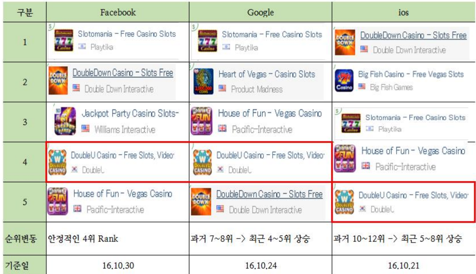
〈플랫폼별 게임(카지노) 최고 매출순위〉

■ 페이스북 플랫폼의 안정적인 시장 지위를 바탕으로 모바일 플랫폼 내 최근 순위 상승 Trends